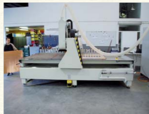
Machine uitgerust voor pendelbedrijf

De machine is verkrijgbaar in volgende afmetingen (andere afmetingen op aanvraag).