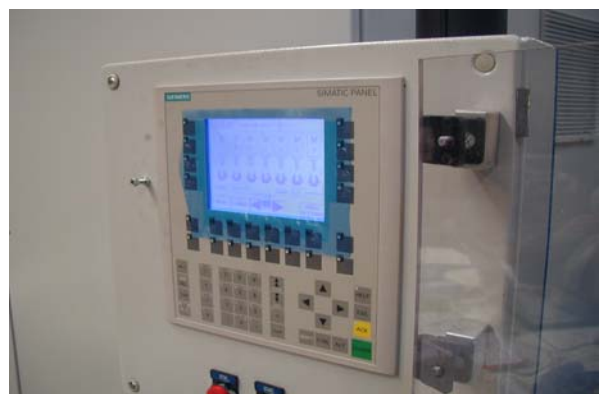
Bedieningspaneel (touch screen) Panneau d'opération Operating panel Bedienpult