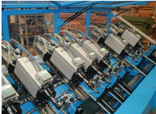
Elektrische booreenheden, met servogestuurde voeding Perceuses électriques (course par moteur servo) Electric drilling units, with servo driven stroke Elektrische Bohreinheiten, mit Hubbewegung über Servo-Antrieb