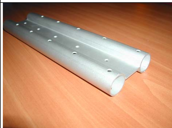
Afgewerkt product (voorbeeld) Pièce usinée (exemple) Finished product(sample) Gefrästes Werkstück (Beispiel)