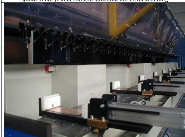
Verplaatsbare pneumatische klemmen Clames pneumatiques réglables Movable pneumatic clamps Verschiebbare pneumatische Klammer