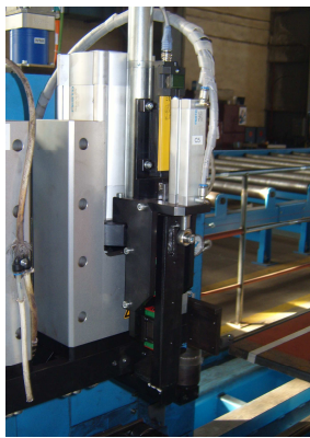
Mechanisch volgsysteem: golvingen van de plaat worden gevolgd Un palpeur mécanique garantit le suivi des ondulations de la tôle Variations in sheet height (swell) are followed by mechanical sensor Abstandssensorik gewährleistet dass die Oberfläche gefolgt wird