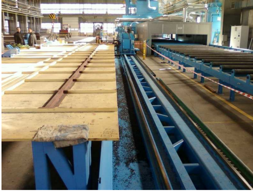
De machine maakt een afschuining in langsrichting La machine réalise le chanfrein dans le sens longitudinal de la tôle The machine realises a chamfer in longitudinal sense of the sheet Die Maschine fräst eine Schweissnaht in Längsrichtung der Platte