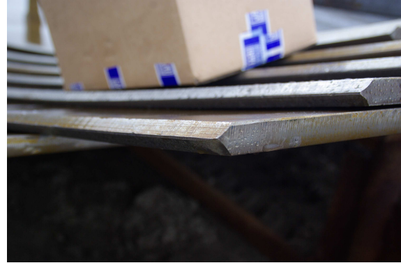
Afgeschuinde platen Tôles chanfreinées Sheet with milled chamfer Stahlplatten mit gefräster Schweissnaht