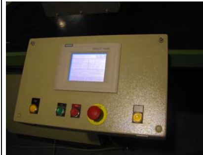
Touch Panel Panneau de commande Operating panel Bedienpult