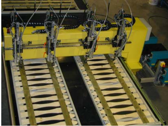
Producten worden manueel ingelegd in een kaliber Les produits sont positionnés dans des drageoirs spécifiques The wooden products are positioned manually in dedicated molds Die Holzprodukte werden manuell in einem Kaliber eingelegt