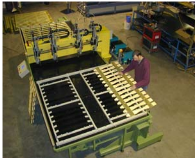
Uitnemen van afgewerkte producten Les produits finis sont sorties The finished products are taken out Die Fertigware werden entfernt